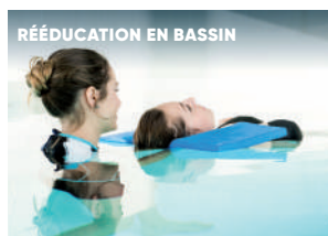
RÉÉDUCATION EN BASSIN