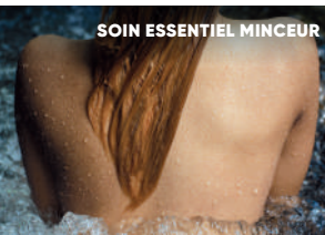
SOIN ESSENTIEL MINCEUR